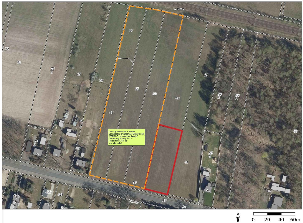
Abbildung 3: Geltungsbereich B-Plan "Sondergebiet großflächiger Einzelhandel „EDEKA-Einkaufszentrum Jeserig“ (gelbe Linie) und Geltungsbereich des B-Plans „Geschäftshaus Potsdamer Landstraße“ (rote Linie) der Gemeinde Groß Kreuz; (Grundlage Luftbild Brandenburgviewer 08/2023 (ohne Maßstab))

Im Bebauungsplan wird die zukünftige Bebauung des Geltungsbereiches dargestellt sowie die Erschließung und Anbindung an das öffentliche Straßennetz dargestellt. Weiterhin wird die landschaftliche Einbindung mit Objektbegrünung und Grünflächenanteil geregelt.